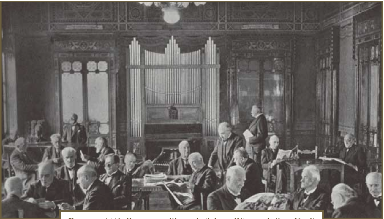
Foto: anni '40, l'organo nell'attuale Salone d'Onore di Casa Verdi

L'organo è uno strumento ad aria compressa costituito da una consolle composta da una a cinque tastiere dette manuali (l'organo del Santuario di Fatima ne ha sette), una pedaliera e vari registri. La pedaliera è una tastiera che, come dice il nome, l'organista aziona con il movimento del piede. Dell'organo fanno parte anche diverse canne, il cui numero varia da uno strumento all'altro. L'aria viene immessa nelle canne da un mantice.