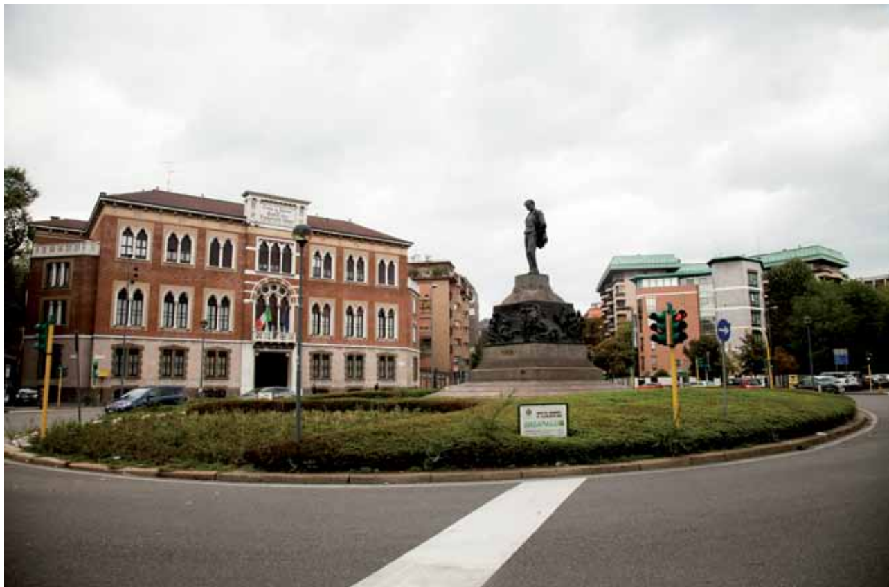
sopra: Facciata di Casa Verdi, progetto di Camillo Boito , foto di Diego Rinaldi nella pagina accanto: alcune delle fotografie donate da Graziella Vigo a Casa Verdi

A dicembre il Salone d'onore è stato teatro di una serata celebrativa per Camillo Boito (1836-1914), scrittore, architetto e restauratore, progettista di Casa Verdi e promotore dell'Accademia di Brera e del Politecnico. Sono stati proprio questi enti ad unire le forze per onorare il poliedrico autore attraverso una serie di iniziative intitolata Camillo Boito Moderno , conclusasi proprio a Casa Verdi il 4 dicembre, giorno del centenario della morte di Boito.